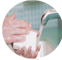
ماء خلط بصابون